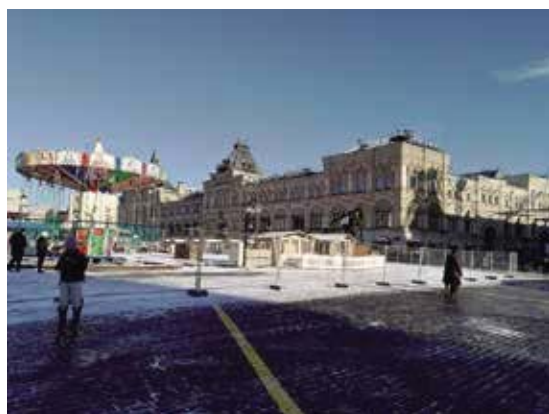
紅場東邊是國家百貨商場，其隔壁有國家歷史博物館。