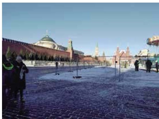
紅場附近有幾處著名建築，包括列寧墓、聖瓦西里大教堂和克里姆林宮。