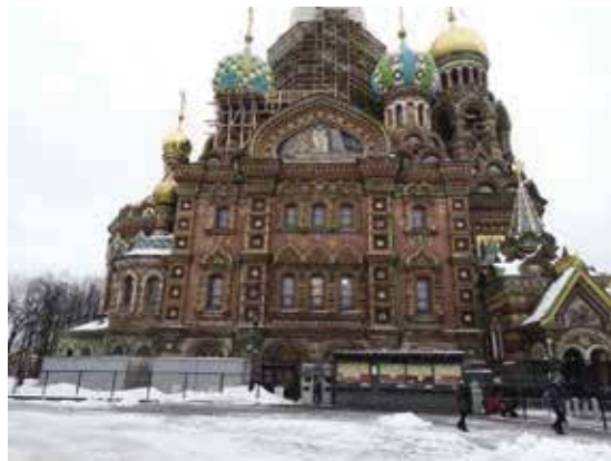
滴血救世主教堂是聖彼得堡的一個主要景點。